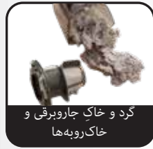
گرد و خاک جاروبرقی و خاک روبه‌ها