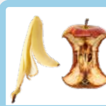
سبزیجات و میوه‌ها؛ پوست‌ها و هسته‌ها