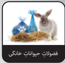
فضولات حیوانات خانگی