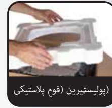
(پولیس‌تیرین) فوم پلاستیکی