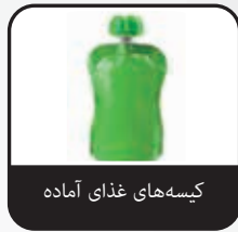
کیسه‌های غذای آماده