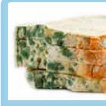
غذای تاریخ‌گذشته یا کپک‌زده