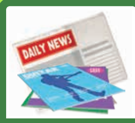
روزنامه‌ها و مجله‌ها