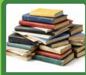
کتاب‌ها — جلد سخت و جلد نرم