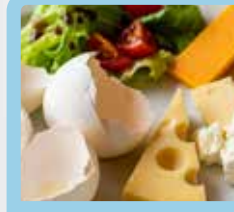
وست تخم‌مرغ، پنیر و سالاد