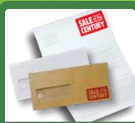
نامه‌ها، پاکت‌ها و سایر کاغذها