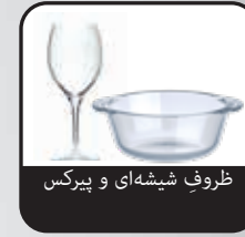
ظروف شیشه‌ای و پیرکس