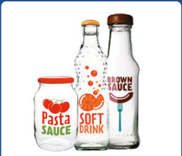
Stikl. buteliai, stiklainiai