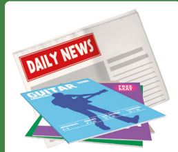
Laikraščiai ir žurnalai