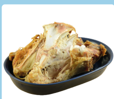
Mėsa, žuvis ir kaulai, virtai ar nevirti

Traukite rankenėlę tolyn, kol ji spragtelės ir įtvirtins dangtį. Išvežimo dieną pastatykite lauke su kitomis dėžėmis.