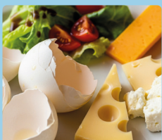
Kiaušinių lukštai, sūris ir salotos

Dieną laikykite mažesnį konteinerį maisto atliekoms patalpoje.