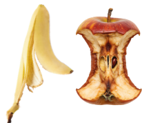
Daržovės ir vaisiai, lupenos ir kauliukai