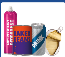
Skardinės ir tušti aer. indeliai