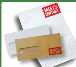
Laišakai, vokai ir kitas popierius