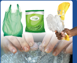
Ploni plastikiniai maišeliai ir plėvelė