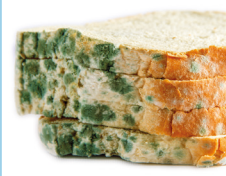
Pasenęs / supelijęs