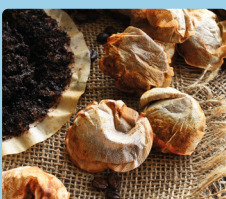
Kavos tirščiai /arbat. maišel.