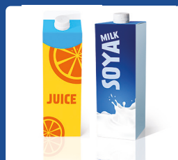
Gėrimų pak. („Tetra Pak“)