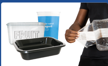
Plastikiniai puodeliai, dėžutės, maisto dėklai ir plona plėvelė