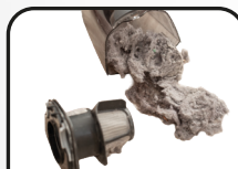
Dulkės, siurbtos/ sušluotos