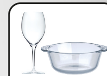
Stiklo gaminiai/ „Pyrex“