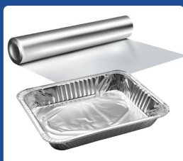
Aliumin. folija ir jos masto dėklai