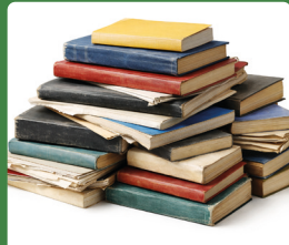
Knygos kietais/ minkštais viršel.