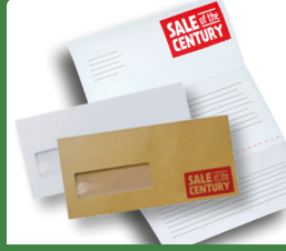
Mektuplar, Zarflar ve diğer Kağıt