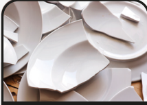
Kırık tabak çanak

Geri dönüşüm kutularına atılmaması gereken malzemelerin çoğu Siyah Çöp Kutusuna atılabilir. Bunlara aşağıda belirtilenler de dahildir: