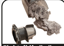
Elektrikli süpürge tozu ve