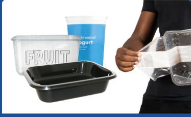
Plastik kaplar, yemek tepsileri ve ince kapak filmi