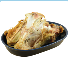
Et, balık ve kemikler; pişirilmiş ya da çiğ