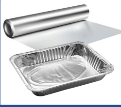
Alüminyum folyo ve folyo yemek tepsileri