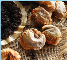
Kahve telveleri ve poşet çaylar