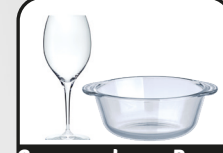
Cam eşyalar ve Pyrex (Isıya dayanıklı cam)