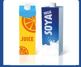
İçecek kutuları (Tetra Pak)