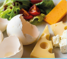
Yumurta kabukları, peynir ve salata