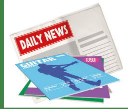
Gazeteler ve Dergiler