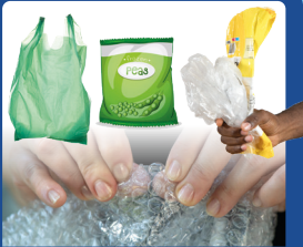
İnce plastik poşetler ve streç film