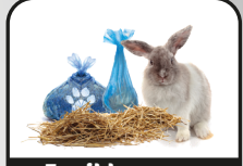
Evcil hayvan atıkları