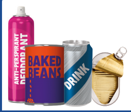
Metal kutular ve boş aerosoller