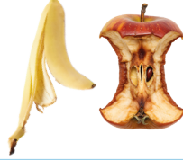
Sebze ve meyve; soyulmuş kabuklar