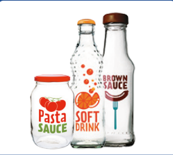
Cam şişeler ve kavanozlar