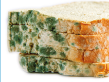
Tarihi geçmiş / küflü yiyecekler